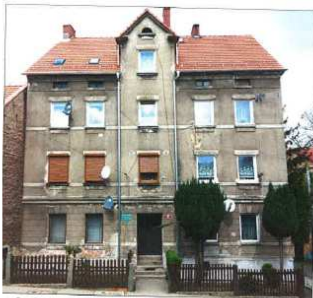
Widok elewacji frontowej – ul. Jarosława Dąbrowskiego.

na sprzedaż lokalu mieszkalnego Nr 7, znajdującego się w budynku położonym w Lubaniu przy ul. Jarosława Dąbrowskiego 3 wraz z udziałem we współwłasności nieruchomości gruntowej (działka nr 31, AM 5, Obręb III o powierzchni 119 m 2 , JG1L/00016290/4)